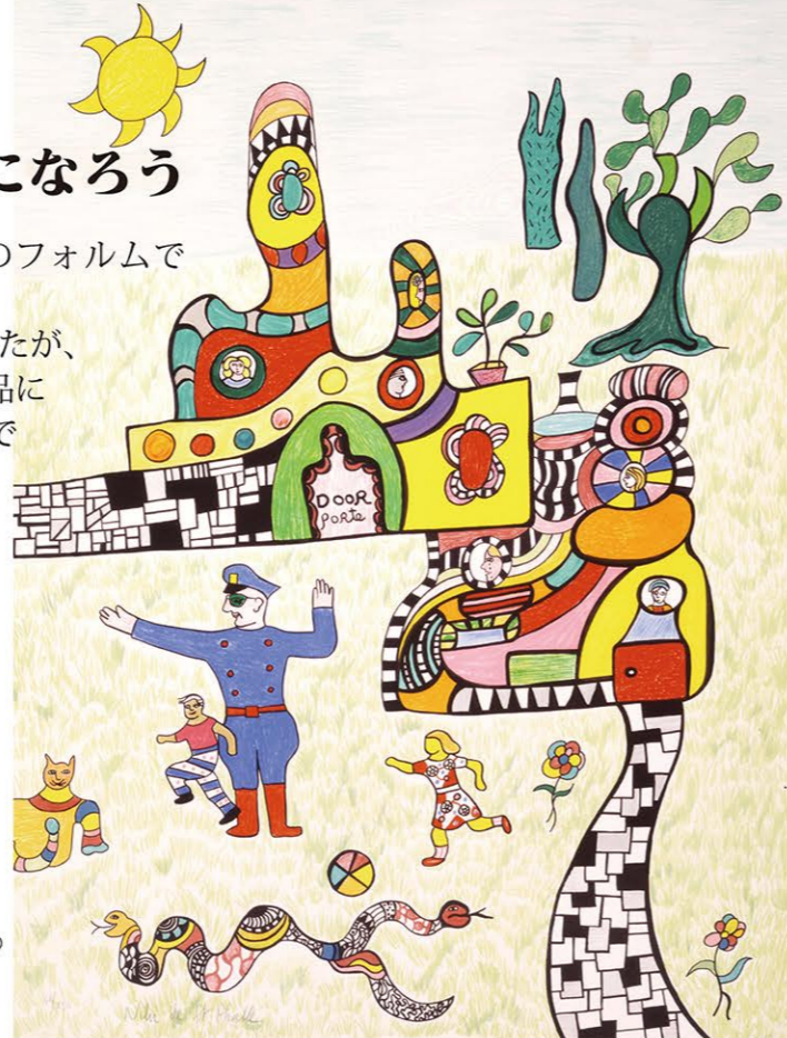
MÉCHANT MÉCHANT (8枚組版画の1枚目)、76×56センチ、1993年作

〒225-0011 横浜市青葉区あざみ野 1-21-11 tel: 045-482-6717 fax: 045-482-6712 E-mail: info@spacenana.com URL: http://spacenana.com